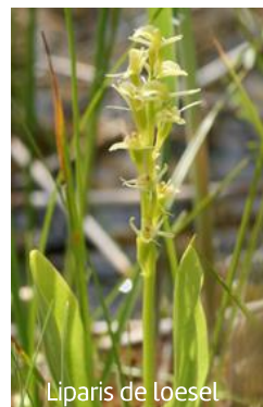
Liparis de Loesel