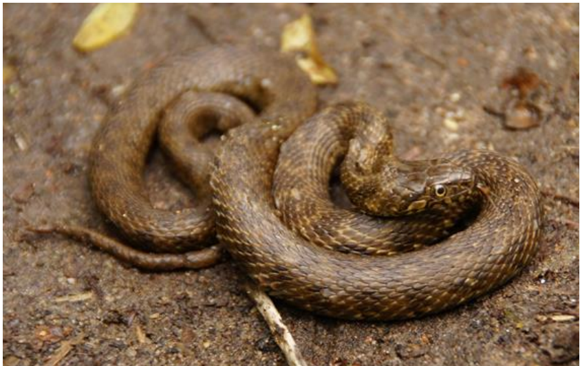
Couleuvre mauresque à l'affût, © F. Bazinet.

Vous l'avez déjà observée ? Contactez la LPO Haute-Savoie et transmettez la localisation et la date de votre observation, la description du serpent et bien évidemment des photos si vous avez pu en faire. LPO Haute-Savoie : haute-savoie@lpo.fr ou 04 50 27 17 74.